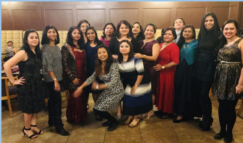
Samhita Holiday Party 2018