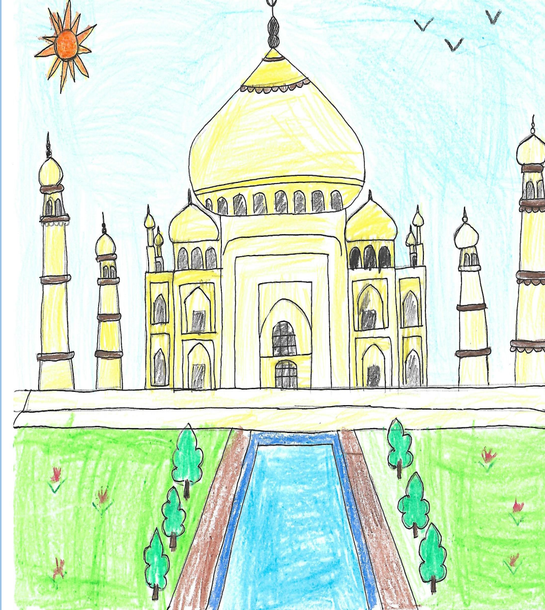
Swarnendu Mukherjee ( 8 Years )